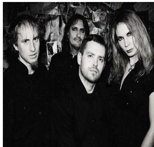
Spracovala : Martina