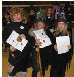
Tri najkrajšie strigy